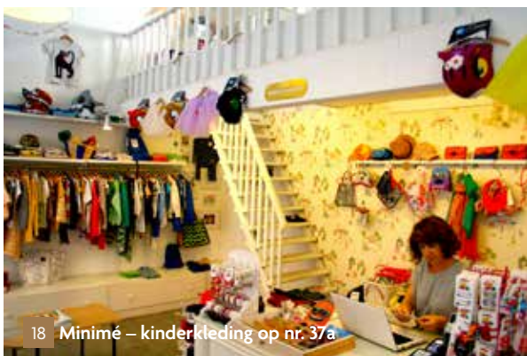
18 Minimé – kinderkleding op nr. 37a