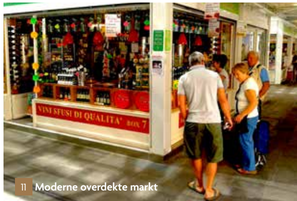
11 Moderne overdekte markt