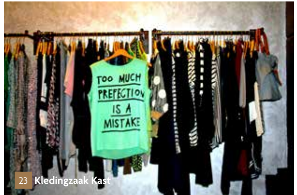
23 Kledingzaak Kast