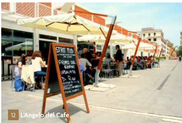
12 L'Angelo del Cafe

Wil je enkele dagen Rome bezoeken maar 's avonds en tussendoor genieten van een frisse tuin en la piscina ? Kijk dan naar de ruime selectie landhuizen in Lazio op www.italianresidence.nl – Parkeren in Rome kan je op diverse stroken langs de Tiber aan 4 euro voor 8 uur.