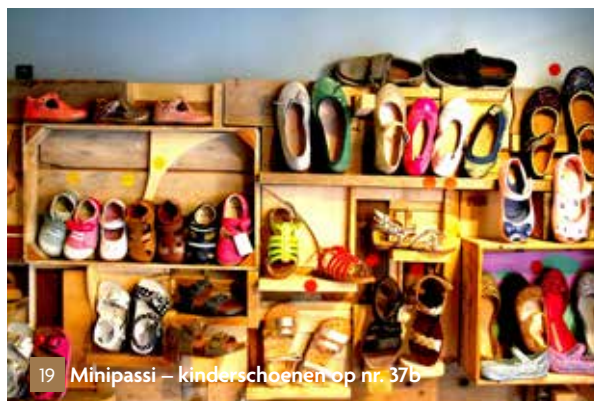
19 Minipassi – kinderschoenen op nr. 37b