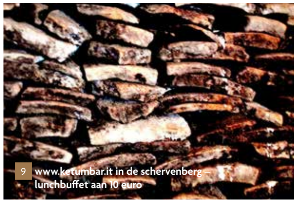
9 www.ketumbar.it in de schervenberg – lunchbuffet aan 10 euro