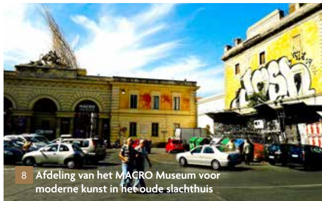
8 Afdeling van het MACRO Museum voor moderne kunst in het oude slachthuis