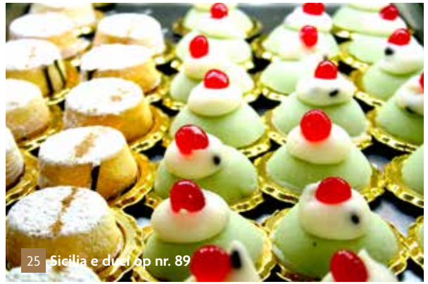
25 Sicilia e dolci op nr. 89