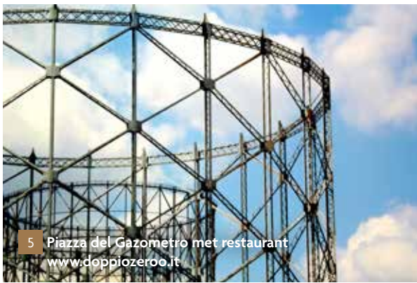
5 Piazza del Gazometro met restaurant www.doppiozero.it