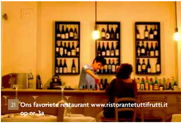
21 Ons favoriete restaurant www.ristorantetuttifrutti.it op nr. 3a