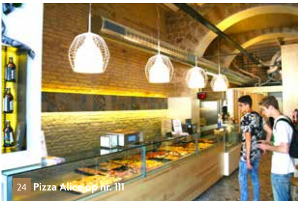
24 Pizza Alice op nr. 111