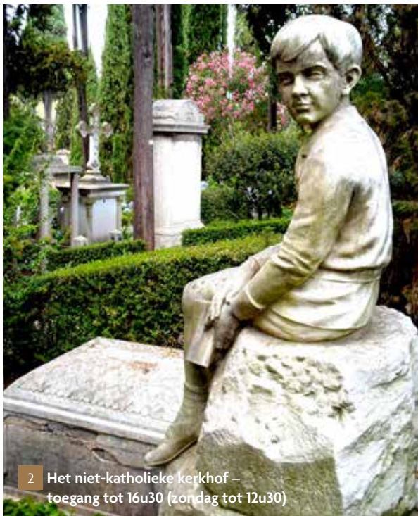
2 Het niet-katholieke kerkhof – toegang tot 16u30 (zondag tot 12u30)

In Testaccio geniet je 's ochtends tussen de Romeinen van un caffè con cornetto , om daarna op de overdekte markt je aankopen te doen, lekker rond te hangen op een pleintje of wat doorgezakt op een bankje tussen de locals te kletsen, en vervolgens een leuk restaurantje op te zoeken voor een lichte lunch. Wil je dan toch wat cultureels doen, dan is er het Macro Museum, en het prachtige 'niet-katholieke' kerkhof waar vooral beroemde buitenlanders liggen, en als je je verder waagt, mooie graffiti-muren.