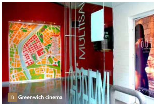
13 Greenwich cinema